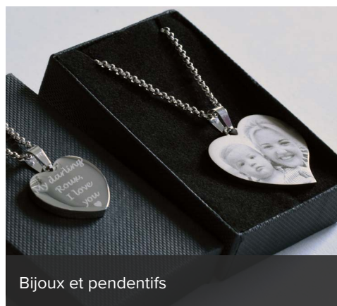
Bijoux et pendentifs