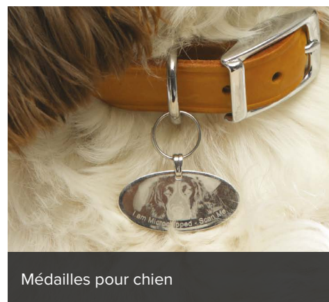
Médailles pour chien