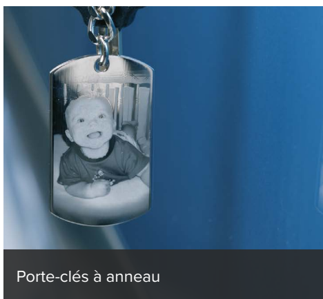
Porte-clés à anneau