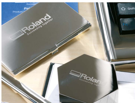
Articles de papeterie personnalisés

Toute votre entreprise tient sur un bureau ou un coin de table, ce qui vous permet d'établir des fondations solides pour développer votre activité à plus grande échelle par la suite.