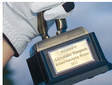
Gravure de trophées